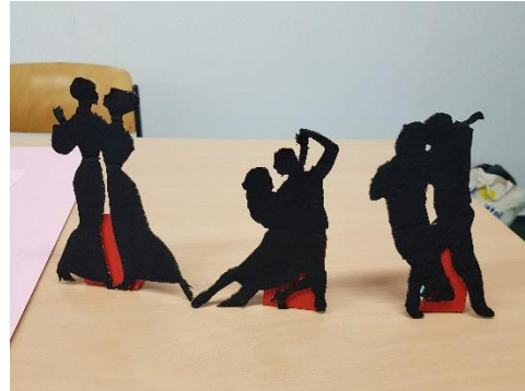
Seminarfach Jg. 13, Vorstellung der Facharbeiten zum Thema „Tango“ am 14.01.2022

Liebe Eltern und Erziehungsberechtigte, liebe Schülerinnen und Schüler, liebe Kolleginnen und Kollegen,