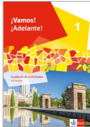
Arbeitsheft ISBN: 978-3-12-537401-0