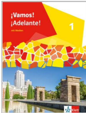
Schulbuch ISBN: 978-3-12-537400-3